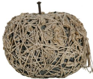
Claudio Cintioli, Chiodo fisso (1970)

Terzo ciclo annuale di seminari del Laboratorio di filosofia e politica dell'immagine Trieste-Gorizia, marzo-maggio 2014